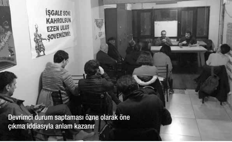
Devrimci durum saptaması özne olarak öne çıkma iddiasıyla anlam kazanır

Devrimci durum koşullarında devrimci ve oportünist tutum konulu söyleşimiz 29 Aralık Salı günü gerçekleştirildi.