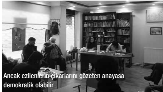
Ancak ezilenlerin çıkarlarını gözetilen anayasa demokratik olabilir

"Demokrasi kimin için meselesini ele almak gereklidir. Öncelikle şu andaki mevcut demokrasinin, burjuva demokrasisi olduğu tespitini yapmak gerekir. Ezilenlerin çıkarlarını gözetecek bir anayasa gerektiği söylenmelidir. Haliyle "demokratik anayasa" dediğimizde ezilenlerin lehine bir anayasa tanımına denk düşer. Peki anayasa nedir? Anayasa, yönetenlerin yönetilmesini sağlayan