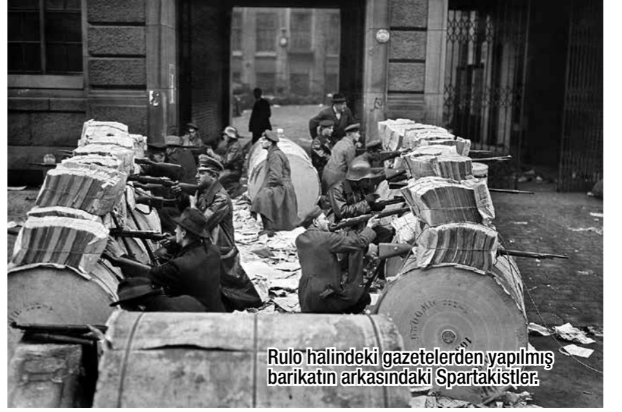
Rulo halindeki gazetelerden yapılmış barikatın arkasındaki Spartakistler.

AYLIK KOMÜNİST GAZETE FİYATI: 2 TL (KDV DAHİL) OCAK 2021 SAYI:23 (120) www.kozgazetesi.org