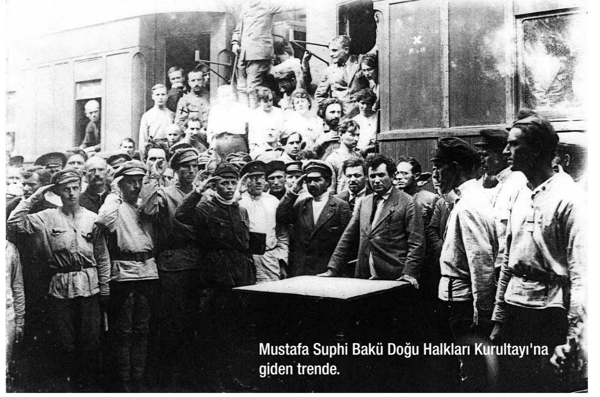
Mustafa Suphi Bakü Doğu Halkları Kurultayı'na giden trende.

“Yoldaş! Bu 15 ölü bizim için nihayet 15 isimsiz komünisttir; ve sen bu isimsiz ölüleri dünyanın her dağında, her köşesinde, her denizinde bulursun! Bu isimsiz ölülerin isimleri cisimleri bizim için hiçtir. Biz her yaşayan işçi kadar, her ölen komünisti de farksız tanıyoruz. Çünkü biz ayrılsız, sınıfsız bir toplum yaratmak istiyoruz.”*