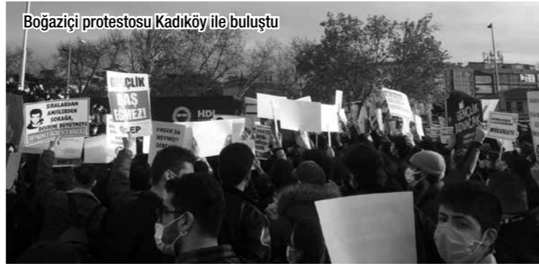
Boğaziçi protestosu Kadıköy ile buluştu

Tasfiyeciliğin yaygın olduğu bir iklimde en çok içi boşaltılan kavramlardan biri de örgüt ve parti. Bizler KÖZ'ün arkasında duran komünistler olarak partisiz öncülük ya da önderlik yapılamayacağı savunuyoruz. Dolayısıyla ne Boğaziçi'nde ne de başka bir çalışmada alanında şu ya da bu direnişe önderlik etme hayali kurmuyoruz. Solda bu tür kuruntulara kapılan parti ve gençlik örgütlerinden farklı olarak öncelikli görevimizin devrimci partiyi yaratmak, bu partiyi yaratacak militanlarla buluşmak olduğunu unutuyoruz. Bu amacımıza da yine solda yaygın olan doktriner ve rekabetçi bir