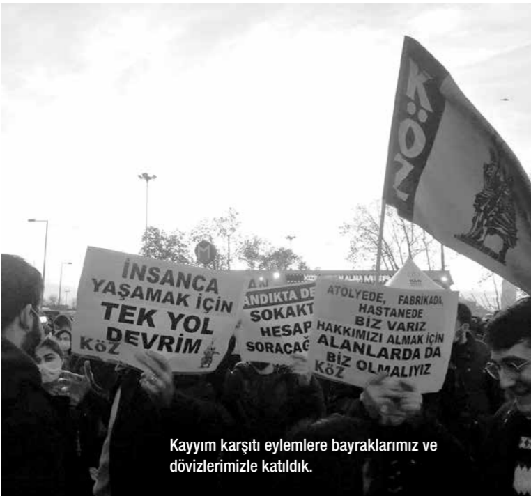
Kayım karşıtı eylemlere bayraklarımız ve dövizlerimizle katıldık.

7 Ocak 14.00'e yapılan eylem çağrısı üzerine üniversiteye giden bütün yollar kapatıldı. Bunun üzerine Boğaziçi Dayanışması