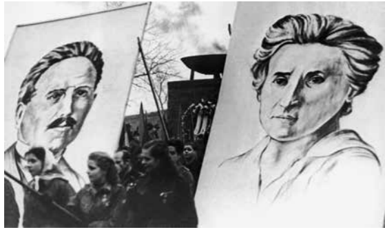
Merkezcilikten geç kopuşun bedeli yalnızca Rosa ve Liebknecht'in hayatı değil, tüm Alman komünist hareketinin tasfiyesi oldu.

Mezubahis Alman Devrimi olduğunda sorumlması gereken işçi hareketinin çok güçlü olduğu, en az Şubat Devrimi kadar şiddetli bir devrimin neden gerçekleşmediği sorusudur. Alman sol-sosyalistlerinin oportünizmle ilişkisi ve merkezciliğe düşmeleri bununla doğrudan alakalıdır. Bolşevizm'in ve muzaffer Ekim Devrimi'nin farkı buradan anlaşılır. Bolşevikler, proleter devrime önderlik edecek devrimci partinin kendini işçi sınıfının en ileri ve devrimci faaliyeti kesintisiz yürüten unsurlarıyla sınırlayan bir parti (bu unsurlar az olduğunda küçük; artınca büyük bir parti haline gelmek üzere) olması gerektiğini savunmuştur. Hem de bu örgütün sadece burjuvaziden değil, oportünistlerden, revizyonistlerden vb. işçi hareketi içindeki farklı siyasal akımlardan da bağımsız ve ayrı olması çok önemlidir. Alman Devrimi'nin yenilgisi işte buradan anlaşılır; proleter devrimin mutlak ögesi Bolşevik Partisi gibi bir parti olmadığı için Alman Devrimi yenilmiştir.