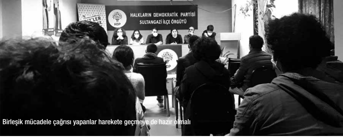
Birleşik mücadele çağrısı yapanlar harekete geçmeye de hazır olmalı

17 Aralık Perşembe günü Gazi Mahallesi'nde, Partizan, SMF, Devrimci Parti, ESP, Mücadele Birliği ve Alınteri tarafından "Faşizme karşı birleşik mücadele" konulu bir panel gerçekleştirildi.