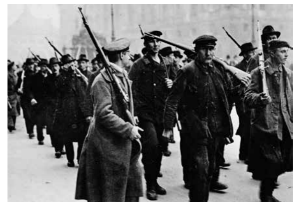
Almanya'da 1918 Kasım Ayaklanması

HDP içinde kalıp devrimciliği yapılabileceğini iddia eden siyasetlerin aldığı tutumları anlayabilmek için merkezciliğin ne olduğunu ve merkezciliğin neden mahkûm etmek gerektiğini kavramak önemlidir. Türkiye sol hareketinin pek aşına olmadığı merkezciliğe oportünist çizginin mahiyeti anlaşıldığında, Kautsky'nin bile yanında marksist hatta devrimci kaldığı HDP'nin içinden devrimciliği yapılabileceği iddiasına sahip çıkanların çarpık tutumunu kavramak mümkündür.