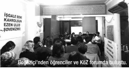
Boğaziçi'nden öğrenciler ve Köz forumunda buluştu.

13 Aralık Çarşamba günü "Boğaziçi'nde Kayyım Eylemleri" başlıklı bir forum-söyleşi gerçekleştirdik. Oturum konuşmacıların anlatımı ile başlayıp soru ve görüşlerle devam etti. Söyleşiye Boğaziçi öğrencilerinden 10 kişi katıldı.