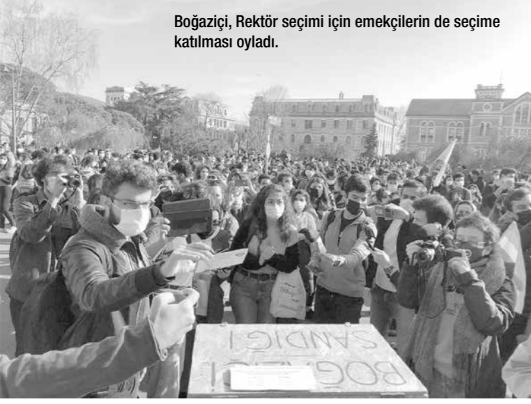
Boğaziçi, Rektör seçimi için emekçilerin de seçime katılması oyladı.

Kayım Rektör İstemiyoruz" ve "Kabul Etmiyoruz, Vazgeçmiyoruz" şiarlarıyla başlayan eylemlerin ilk gününde üniversite idaresi kampüse girmemize izin vermemiş, içeriye girmek için polis bariyerine yüklendiğimizde de polis plastik mermi, gaz ve tazyikli suyla saldırmıştı. Saldırının ardından basın açıklaması gerçekleştiren öğrenciler eylemleri çarşamba günü Güney Kampüs kapısı önünde sürdürdüğünü duyurmuştu. Salı günü eyleme katılan öğrencilerin gözaltına alınmasının ardından, Boğaziçi Dayanışması 6 Ocak Çarşamba Güney Kampüs önüne bir basın açıklaması çağrısı yaptı. Bu çağrıya farklı üniversitelerden öğrenci dayanışmaları, demokratik kitle örgütleri, gençlik örgütleri ve birçok sol akım destek ve katılım çağrısı yaptı. Buna paralel olarak birçok farklı şehirde de üniversitede destek eylemleri çağrısı yapıldı. Bu çağrının ardından eylem sabahı İstanbul Valiliği Beşiktaş ve Sarıyer'de gerçekleştirilecek bütün eylemleri yasakladı. Bunun üzerine Boğaziçi Dayanışması basın açıklamasını saat 16:00'da Kadıköy rıhtıma yaptı.